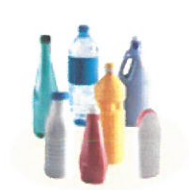
· Bouteilles, bidons et flacons en plastique