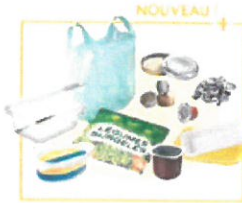
· Pots, barquettes, sacs, sachets, boîtes, suremballages en plastique · Petits emballages en aluminium